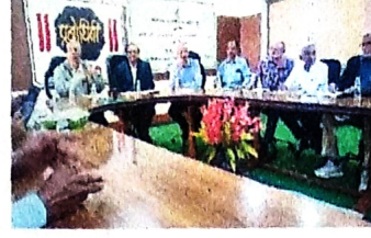
वार्षिक सर्व साधारण सभा