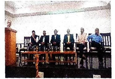
सविस्तर वृत्तांत पुढील अंकात देणेत येईल.