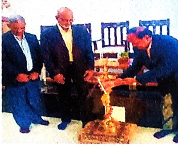
कार्यक्रमाचे उद्घाटन दीप प्रज्वलन