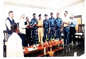
वन कार्याबद्दल सन्मानपत्र व स्मृतिचिन्ह देवून सन्मान